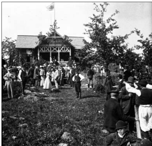
A menedékház felavatása 1898-ban

A kirándulók nagy tömege kora reggel a Nyugati pályaudvaron gyülekezett, egyszerre Eötvös Loránd is föltűnt a gyülekezők közt. A vonat 6 óra 15-kor indult, megtömve a lelkes turisták zsivalgyó csapatával. Az Állatkert és a millenniumi kiállítások kísérőjeként 1896-